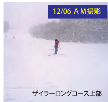
ザイラーロングコース上部

今年の安比は雪も違います!コンディション絶好調! フカフカの雪が順調に積もっております。