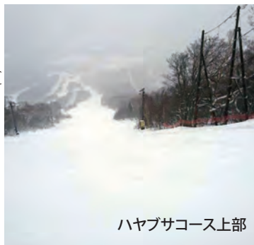
ハヤブサコース上部