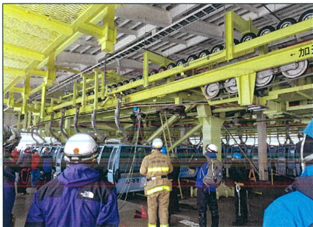
◇消防署との合同救助訓