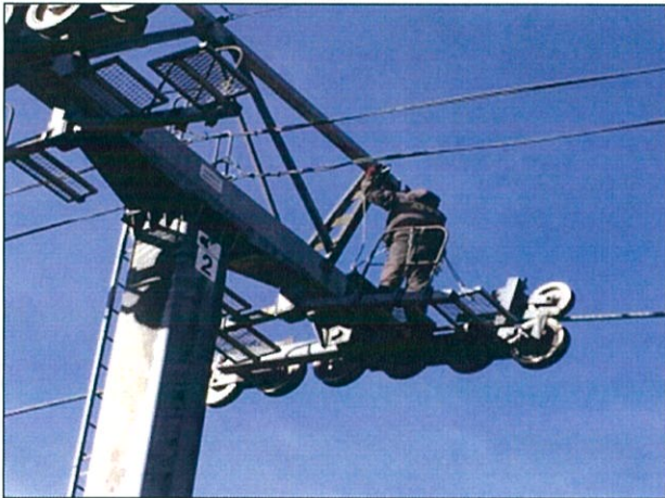
◇ゴンドラ支柱点検整備