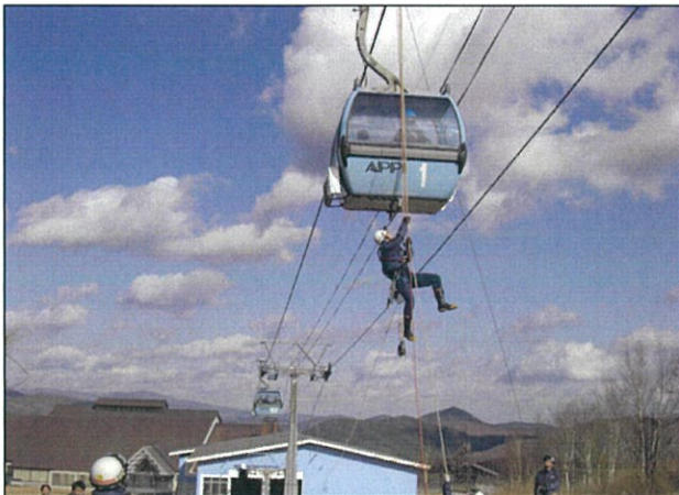
◇消防署との合同救助訓