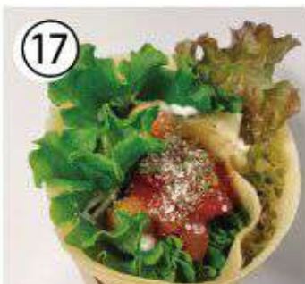
⑰ サルサウインナー ¥800 salsa Wienerr