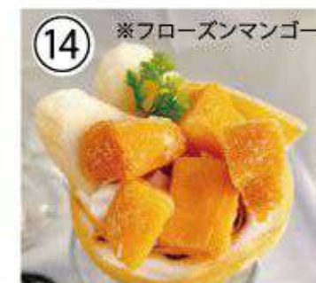
⑭ ※フローズンマンゴー マンゴーバナナ ¥900 mango banana