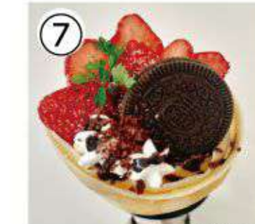
⑦ いちごオレオクッキー ¥900 strawberry oreo cookies