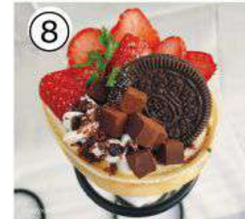
⑧ いちご生チョコクッキー ¥1000 strawberry raw chocolate cookie