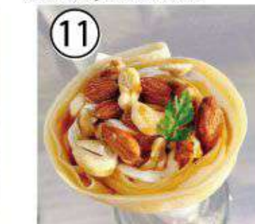
⑪ キャラメルナッツ ¥700 caramel nuts