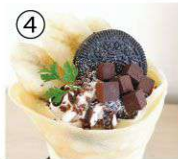
④ パナナ生チョコクッキー ¥900 banana raw chocolate cookies