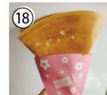
⑱ シュガーバター ¥700 sugar butter