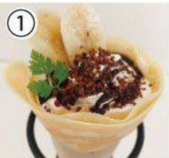
① パナナチョコ ¥700 banana chocolate