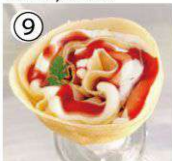
⑨ ストロベリーチーズ ¥700 strawberry cheese