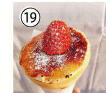
⑲ いちごブリュレ ¥900 strawberry Brulee