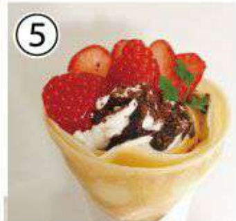
⑤ いちごチョコ ¥800 strawberry chocolate