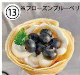
⑬ ※フローズンブルーベリー ブルーベリーチーズ ¥800 blueberry cheese