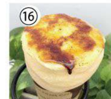
⑯ ブリュレ ¥800 Brulee