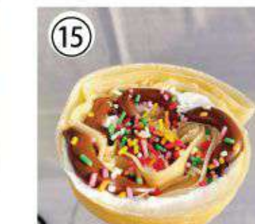
⑮ ポップチョコ ¥700 pop chocolate