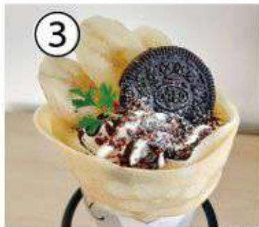
③ パナナオレオクッキー ¥800 banana oreo cookies