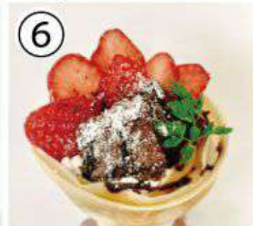
⑥ いちごガトーショコラ ¥900 strawberry gateau chocolate