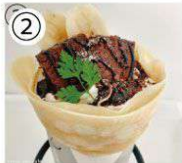
② パナナガトーショコラ ¥800 banana gateau chocolate