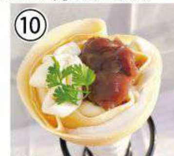
⑩ あんこチーズ ¥700 Anko cheese